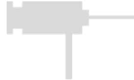
名称: 金属微液滴发生器 型号: EFL-MS-D1