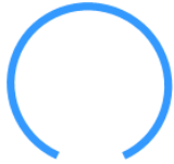
名称: 硅胶管001 型号: EFL-MS-ST-001